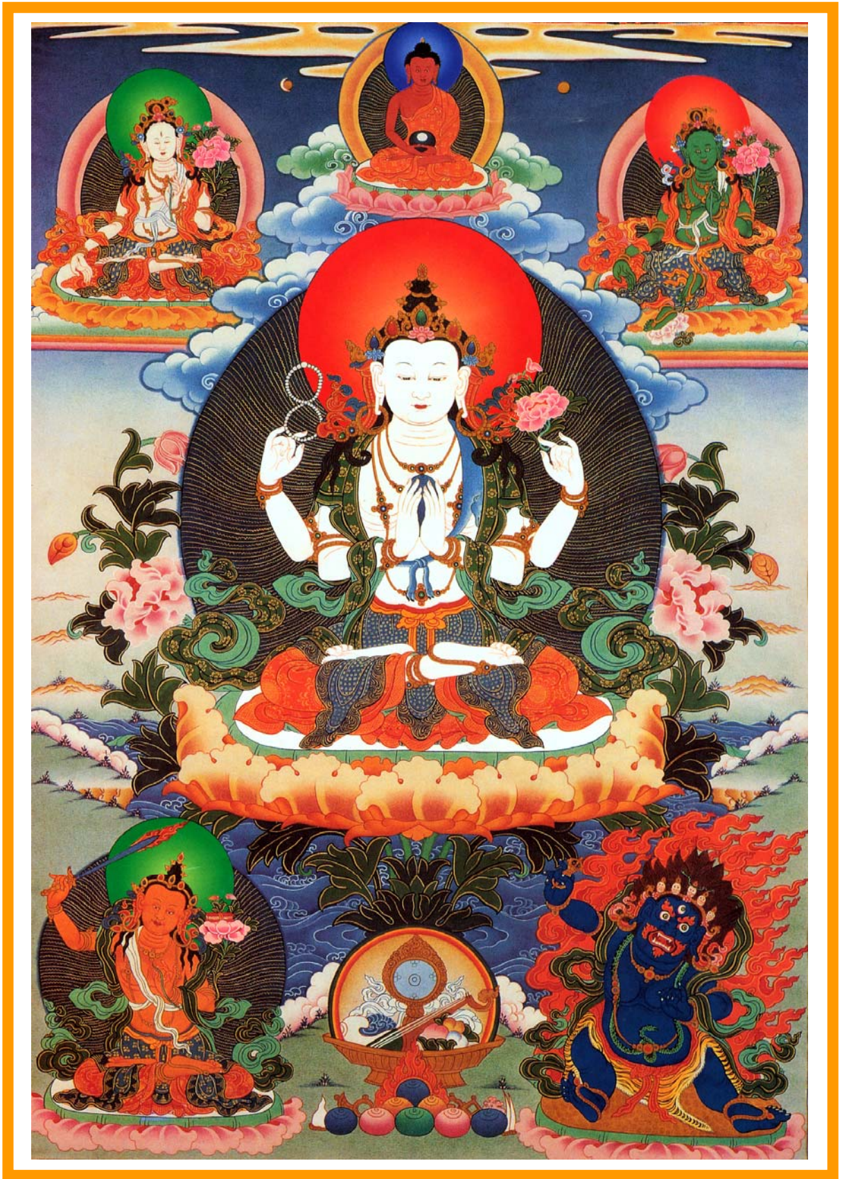
南无观音文殊金刚手菩萨摩诃萨