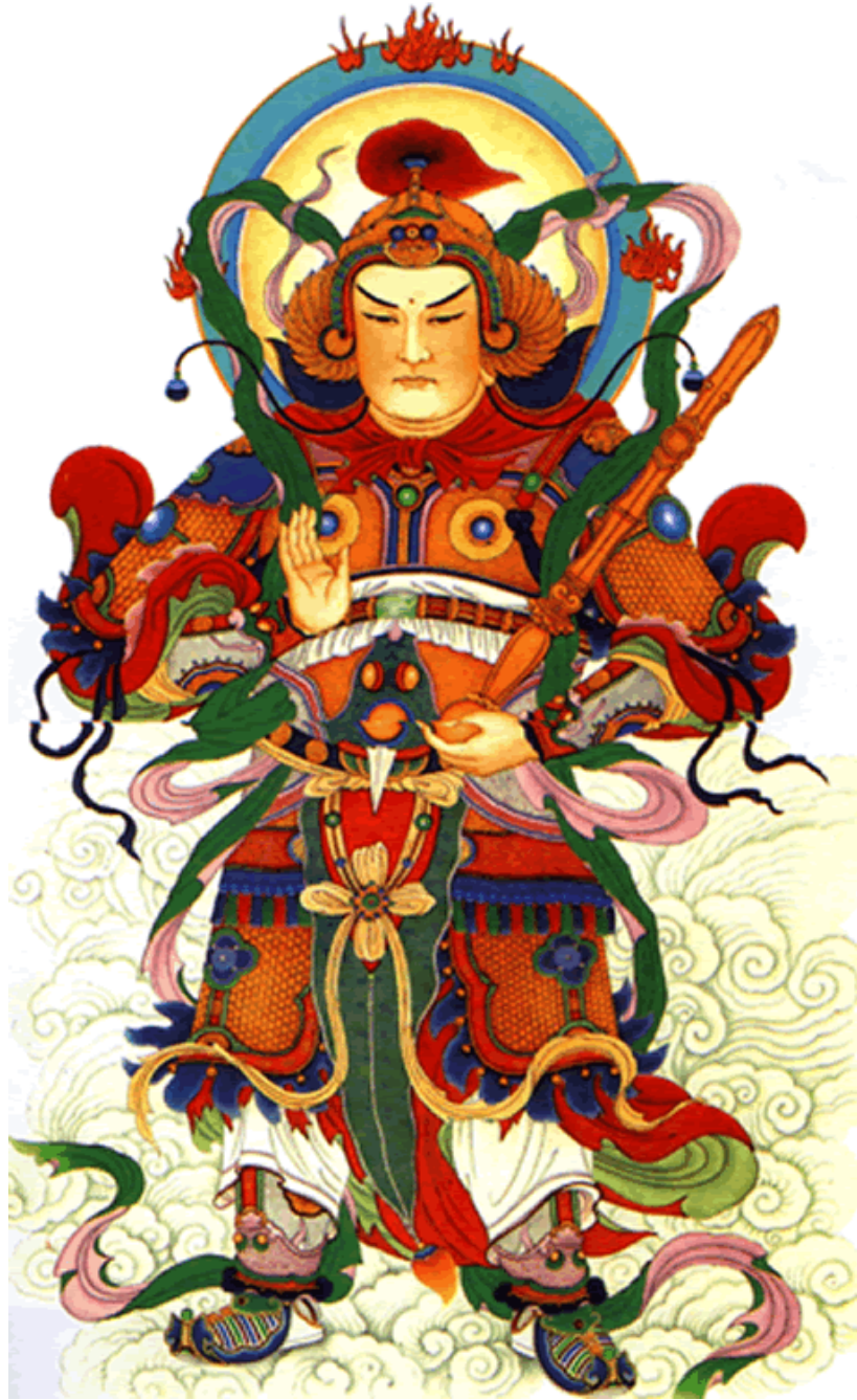
南无护法韦驮尊天菩萨