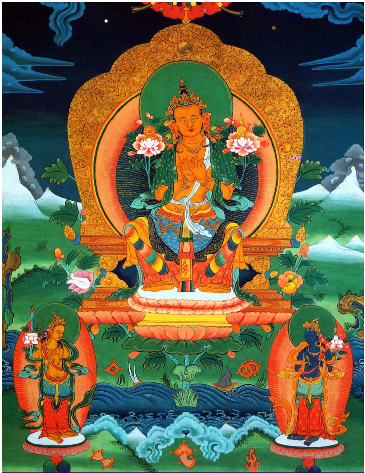
南无弥勒菩萨摩河萨