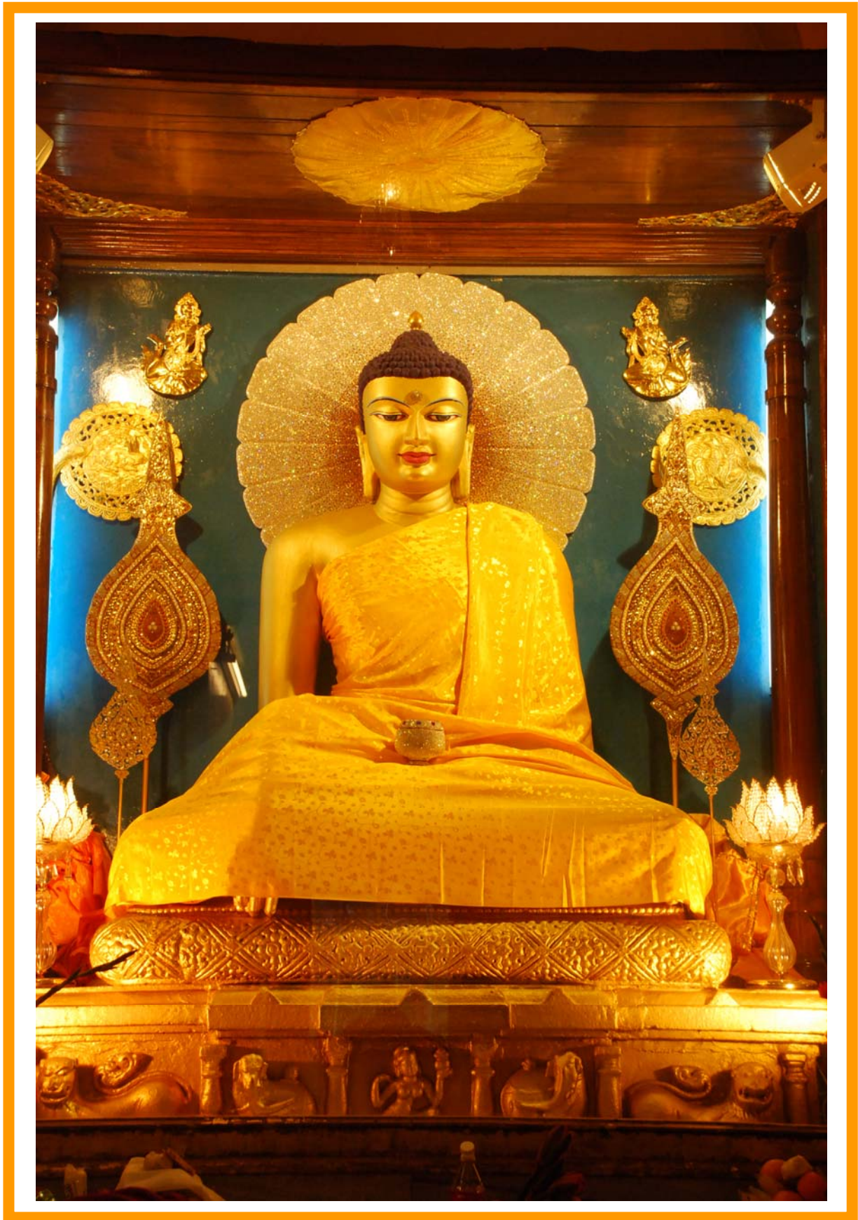
南无本师释迦牟尼佛