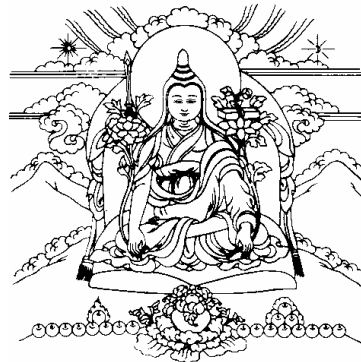
གྲོང་ཚེན་རབ་འབྲམས། 12、无垢光尊者