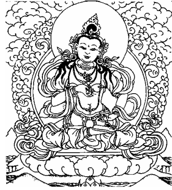
ཡོངས་སྐུ་རྩོ་རྩེ་སེམས་དངའ། 2、报身金刚萨埵