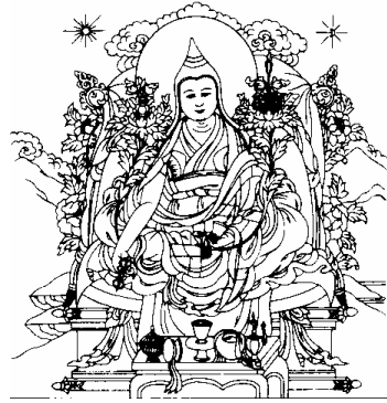
འཇམ་དབྱེངས་མཁའ་ལྷན་བརྟེན་བའོ། 16、蒋扬钦哲汪波