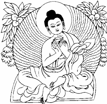
སྐུ་ལ་སྐུ་དགའ་ལ་བབ་རྩོ་རྩེ། 3、化身极喜金刚