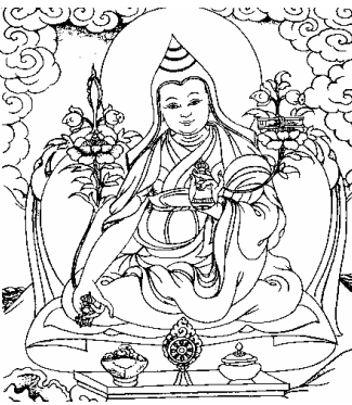
མི་པམ་རིན་པོ་ཆེ། 17、麦彭仁波切