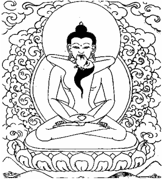
ཚོས་སྐུ་ཀུན་ཏུ་བཟང་པོ། 1、法身普贤如来