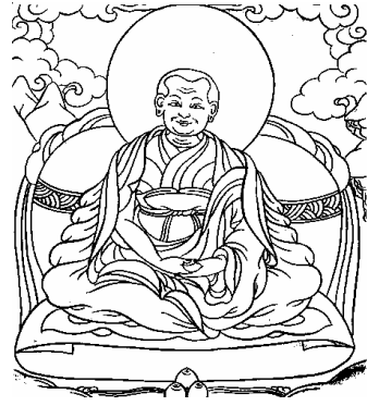
འཛིགས་མེད་རྒྱལ་བའི་ལྷ་སྐུ། 14、无畏如来芽