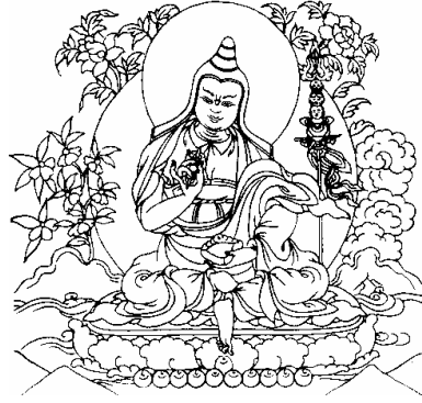
པན་སྐ་རྟ་མ། 8、莲花生大士