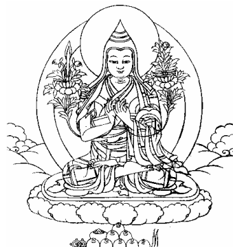
ཚོས་ཇེ་འཛིགས་མེད་ལུན་ཚོགས། 18、法王晋美彭措