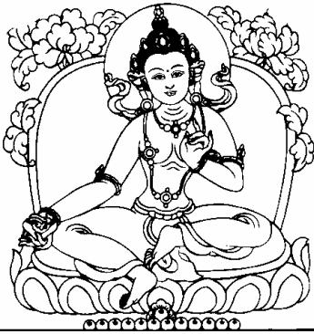
ཡེ་ཤེས་མཚོ་རྒྱལ། 11、益西措嘉