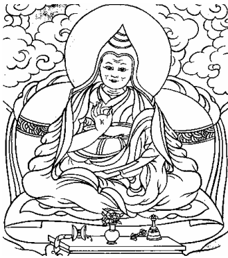
དབལ་སྐུལ་རིན་པོ་ཆེ། 15、华智仁波切