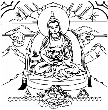
བི་མ་མི་ཏྲ། 7、布玛莫扎