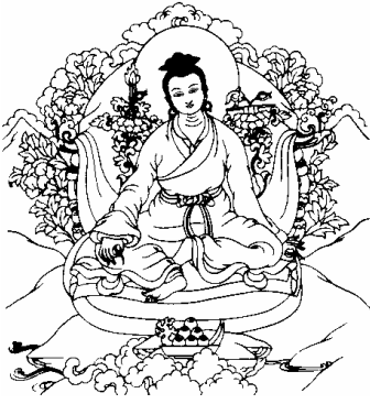
རིག་འཛིན་འཛིགས་མེད་གླིང་པ། 13、持明无畏洲