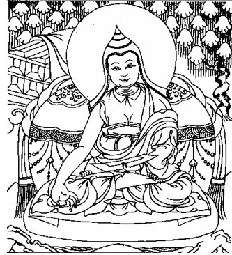
བི་རོ་ཙན། 10、贝若扎那