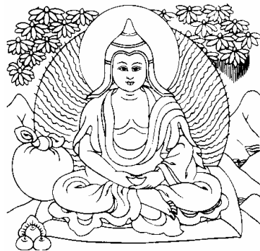
འཇམ་དངའ་ལ་བཤེས་གཉེན། 4、文殊友