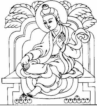
ཁྲི་སྲོང་ལྷེ་ལུ་བཙཅན། 9、赤松德藏