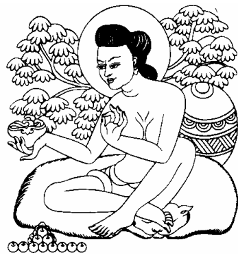
རྫོན་སུ་ཏ། 6、嘉纳思扎