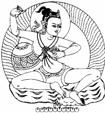
ཕྱི་སིང་ཏ། 5、西日桑哈